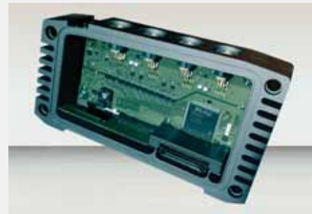
DuT - Adapter Modular