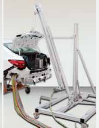
Beispiele: EOL, Sitzprüfstand, IMOT